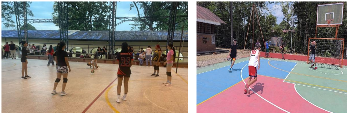
Figura 7 Espacio de práctica deportiva de Fútbol Sala Femenino San Antonio y Basquetbol Barcelona