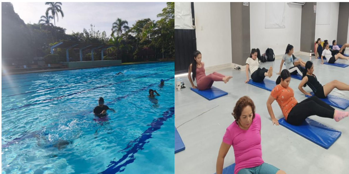
Figura 6 Espacio de práctica de la modalidad de natación y yoga.