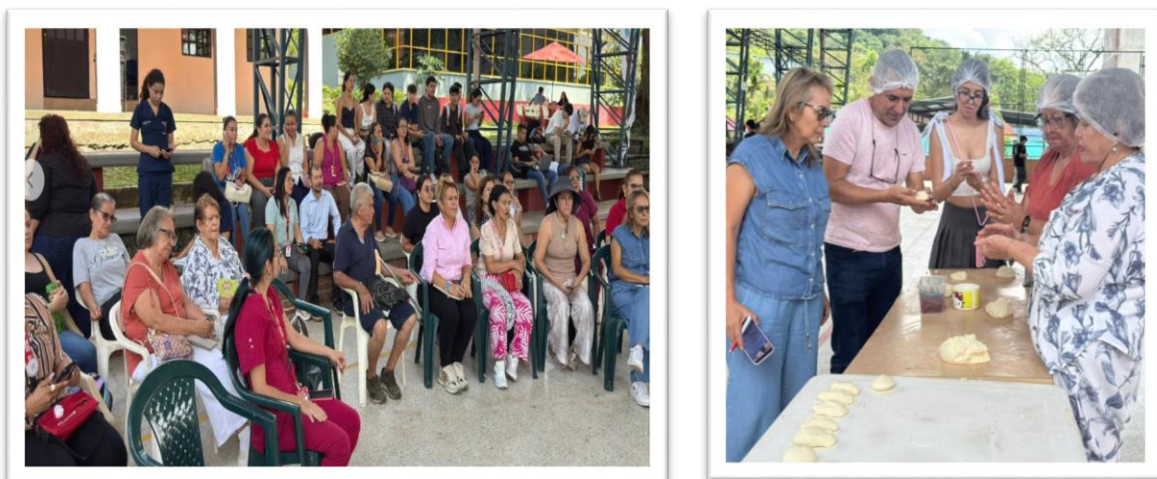
Figura 11 Taller de amasijos tradicionales campus San Antonia