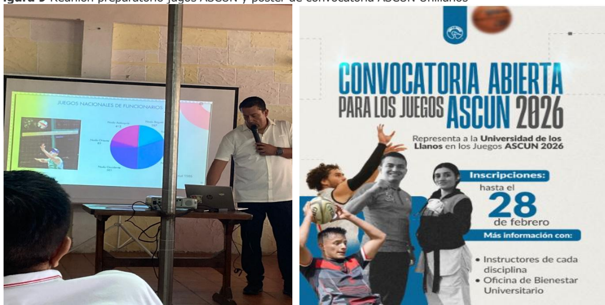
Figura 9 Reunión preparatorio jugos ASCUN y poster de convocatoria ASCUN Unillanos