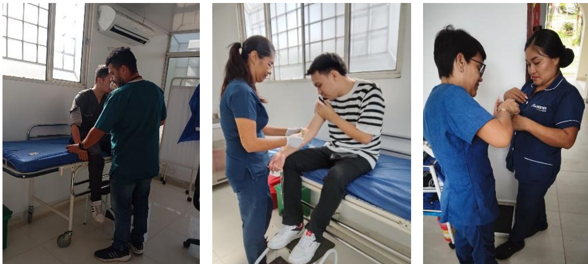
Figura 3 Asesoría médica en campus Barcelona y asesoría enfermería del campus Boquemonte y San Antonio