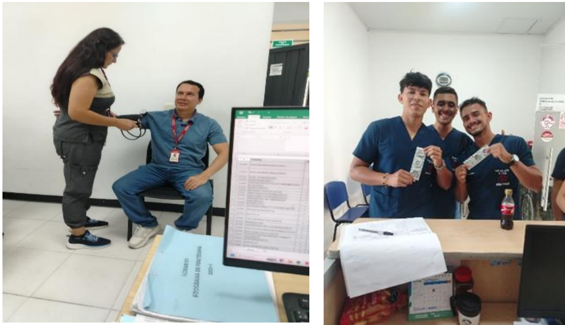
Figura 4 Tamizaje cardiovascular y Jornada de prevención de enfermedades de transmisión sexual