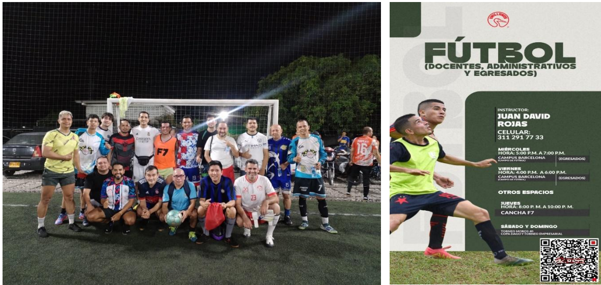
Figura 8 Equipo de fútbol docentes, administrativos y egresados.