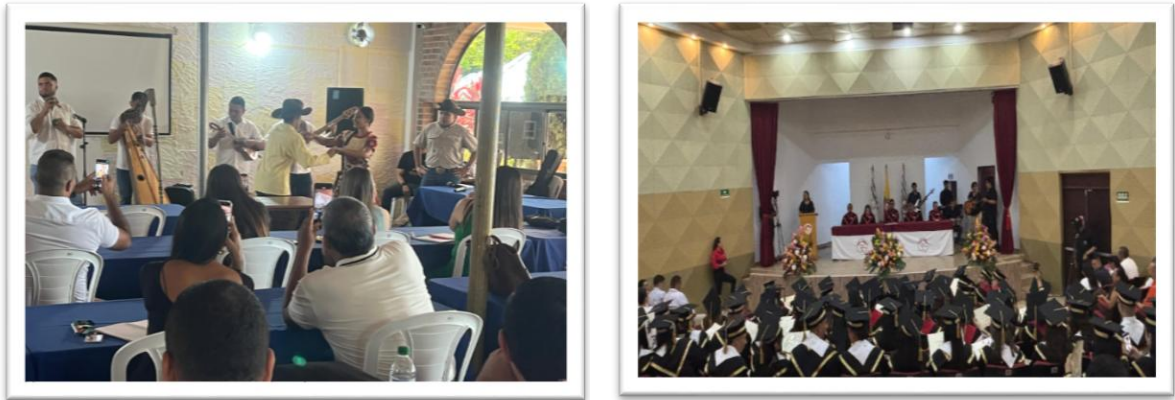
Figura 10 Acompañamiento a la Zonal reunión ASCUN y la Ceremonias de Graduación del mes de marzo