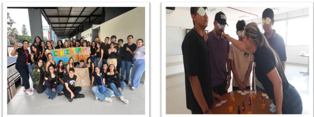
Figura 1 Imágenes de los espacios de sensibilización en temas de salud mental