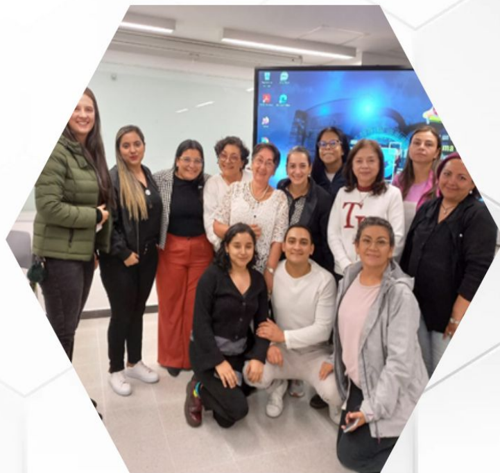
Movilidad Manzanas del Cuidado