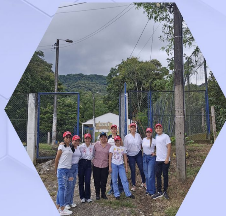
Prácticas de Cuidado Comunitario rural