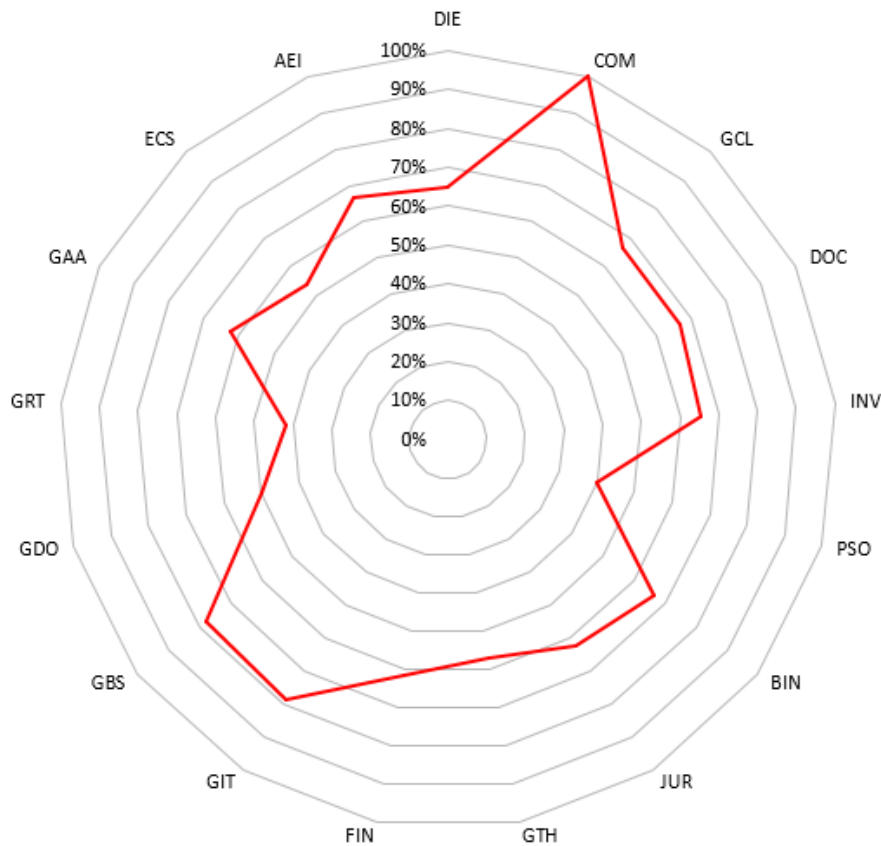
Figura 2. Porcentaje de Cumplimiento Acciones de Mejora o de Control Propuesta

Comparando los datos de porcentaje de cumplimiento de los (17) procesos de gestión de la universidad, se evidencian (3) procesos con un cumplimiento menor o igual al 50% en las acciones asociadas al tratamiento del riesgo y catorce (14) procesos con un porcentaje de cumplimiento mayor al 50%.